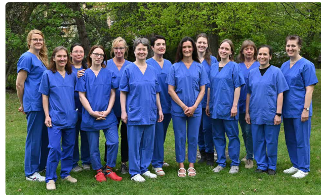
Team der Hebammen