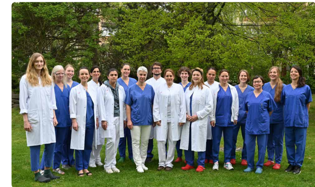
Team der Ärzt*innen